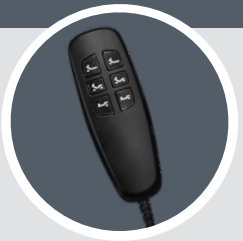
Télécommande filaire incluse