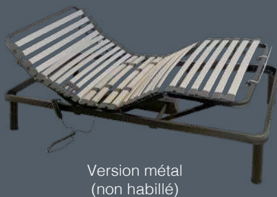
Version métal (non habillé)