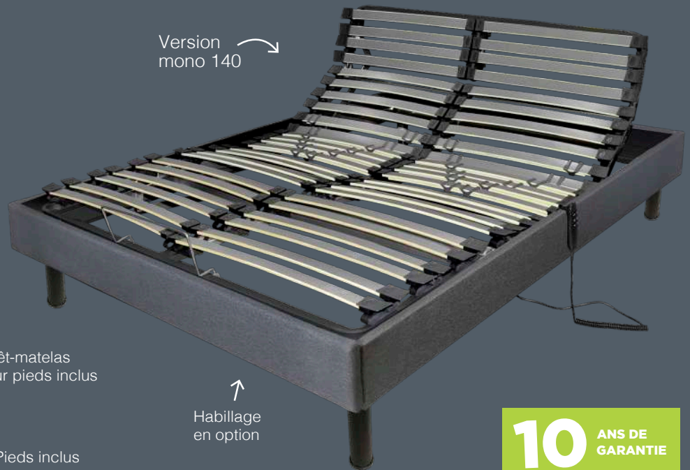
Version mono 140