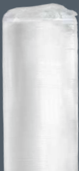
Matelas livré roulé