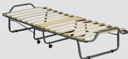
Vue dépliée sans matelas